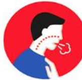
Falta de aire