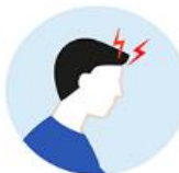
Malestar o dolor de cuerpo y/o cabeza